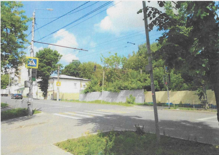
Пешеходный переход к остановке общественного транспорта на ул. Салтыкова - Щедрина