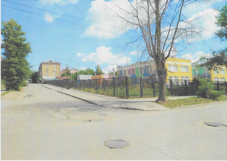
Перекресток ул. Знаменской и ул. Беляева