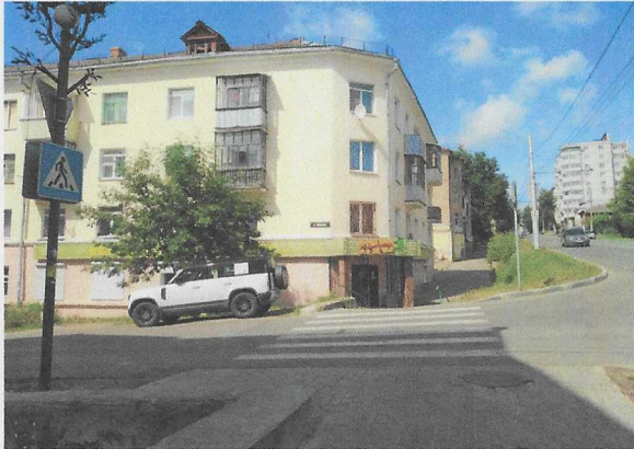
Пешеходный переход на перекрестке ул. Беляева и ул. Салтыкова-Щедрина