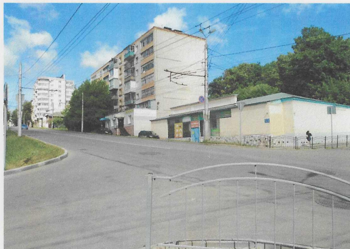
Перекресток ул. Беляева и ул. Салтыкова-Щедрина